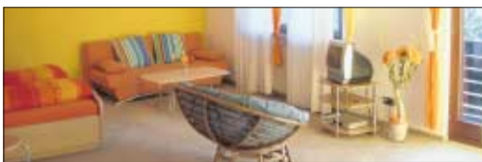
Freundlich und hell: Blick in eines der Holzhäuser

Lange Reihe 12 · 36358 Herbstein Telefon (0 66 43) 5 52 · Fax (0 66 43) 79 99 67