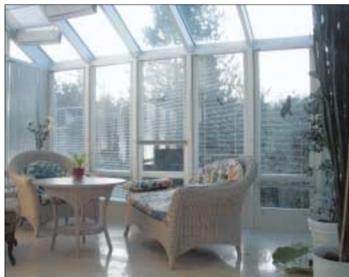
In der Wohnanlage kann auch ein Wintergarten genutzt werden.

nung auf drei Blockhäuser reduziert, da man damit die Kapazität von maximal 30 Gästebetten erreicht hatte.