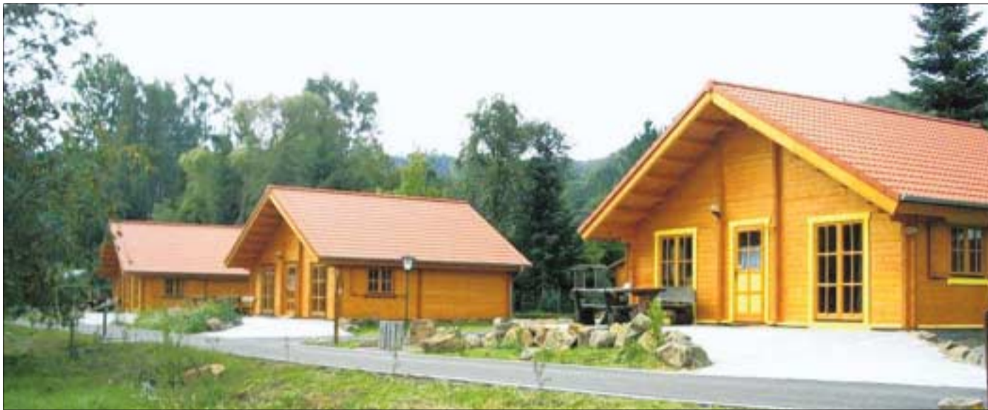
Urlaub mitten in der Natur: Das bieten die schmucken Holzhäuser im „Grünen Paradies“.